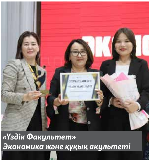
«Үздік Факультет» Экономика және құқық акультеті

Оқу жылы аяқталар тұста университетімізде әр сала бойынша оза шауып, жастық жігерін жақсы жағына жұмсап жүрген белсенді студенттерді, ғылым, білім саласында айрықша орны бар үздіктерді анықтау үшін дәстүрлі «Жыл үздігі-2023» байқауы ұйымдастырылды. Нәтижесінде байқау қатысушылары келесі аталымдар бойынша анықталды. Сонымен қатар, үздік студенттер ректор және проректор Алғыс хаттарымен де марапатталды.